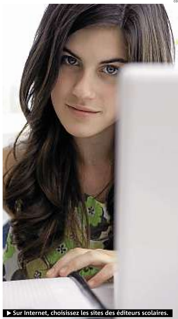
► Sur Internet, choisissez les sites des éditeurs scolaires.