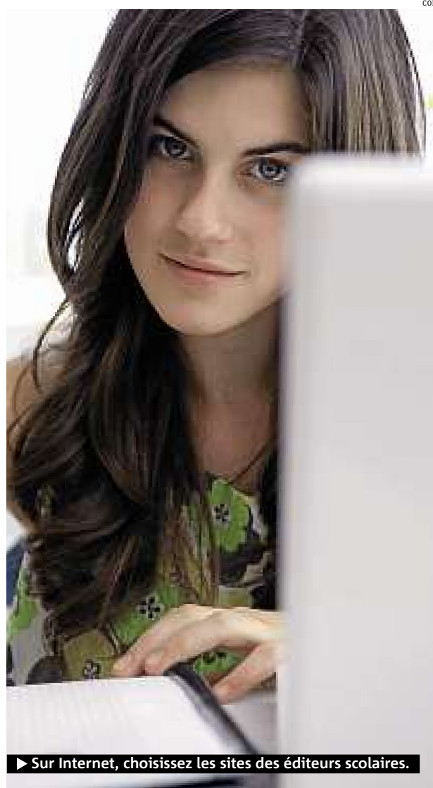
► Sur Internet, choisissez les sites des éditeurs scolaires.